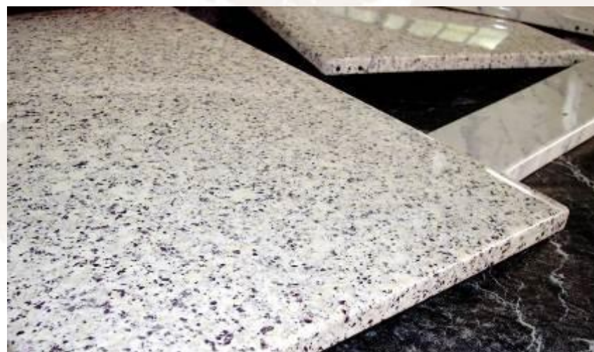
Efectos mármol con polvos de sublimación brillantes

Se dispone de una gran variedad de colores para esta serie de productos que se valorizan al máximo en la decoración con tecnología de sublimación.