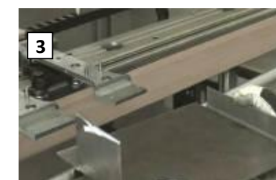
Pliegue de las chapas decoradas