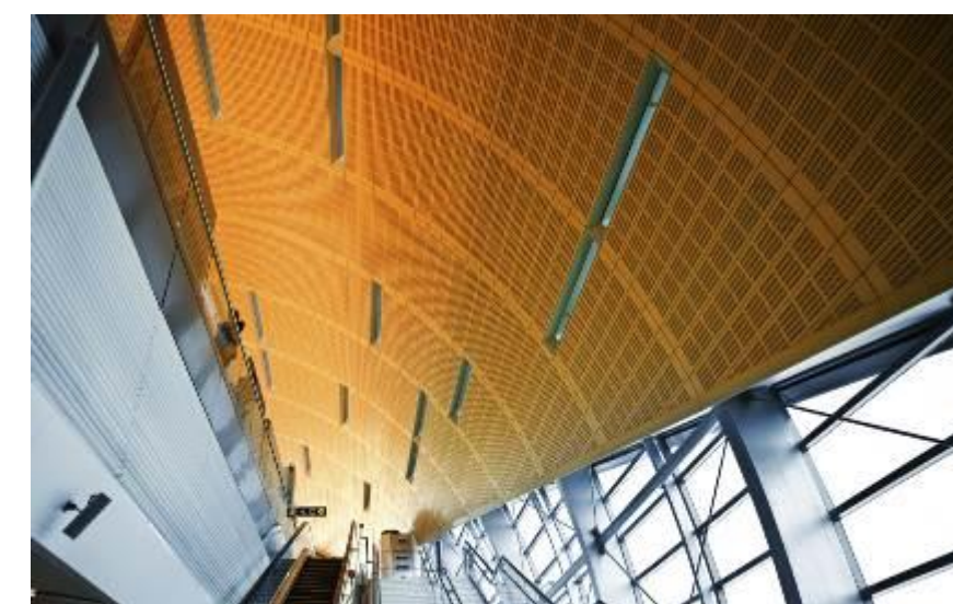
Falsos techos metro Dubai

Las especiales propiedades mecánicas de la serie 3C-XXX-A015 (PS-06XXP3) se valorizan al máximo en la producción de falsos techos, puertas, objetos de decoración (arquitectura interior) y todos aquellos procesos en los que el plegado post-decoración de los laminados es una facilitación del proceso de producción.