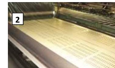
Decoración de chapas lisas en prensas industriales